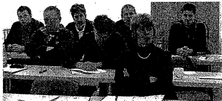
Predavanje v cerkniškem Brestu na temo »Eko-inovacije so dober posej« je prisluhnilo 14 zaposlenih iz Bresta, dva predstavnika podjetja Vibacom, dva predstavnika Srednje gozdarske in lesarske šole iz Postojne ter predstavnika organizatorja RRA Notranjsko-kraške regije, d.o.o., ki so bili z vsebino izobraževanja zelo zadovoljni.

Izobraževanja za velika in srednja podjetja na temo Eko-inovacije so dober posej, so usmerjena v dvigovanje zavesti in znanja o vlogi eko-inovativnosti v podjetjih ter ozaveščanje poslovnih akterjev Notranjsko-kraške regije o eko-inovacijah kot ugodnih poslovnih priložnostih. Na izobraževanjih se bodo udeleženci spoznali s temeljnimi pojmi inovacijskega sistema, modelom poslovne evolucije, ključnimi poslovnimi procesi in modeli odnosov, značilnostmi inovacijskih procesov in številni primeri dobrih praks inovacij. Še posebej o t. i. inovaciji za trajnostni razvoj. O teh so notranjsko-kraški gospodarstveniki razpravljali že na letošnji 3. razvojni konferenci, ki je bila organizirana junija letos. Da je inovativnost vzvod družbenih sprememb in ne samo gospodarske rasti, dokazujejo primeri dobrih praks številnih tujih pa tudi slovenskih podjetij, ki so bila prej v rdečih številkah, zdaj pa uspešno poslujejo, med njimi Ste-