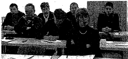
Predavanju v cerkniškem Brestu na temo: Ekoinovacije so dober posel , je prisluhnilo 14 zaposlenih iz Bresta, dva predstavnika podjetja Javor iz Pivke, predstavnica Srednje gozdarske in lesarske šole iz Postojne ter predstavnici organizatorja RRA Notranjsko-kraške regije d.o.o., ki so bili z vsebino izobraževanja zelo zadovoljni.

Izobraževanja za velika in srednja podjetja na temo: Ekoinovacije so dober posel , so usmerjena v dvigovanje zavesti in znanja o vlogi eko-inovativnosti v podjetjih ter ozaveščanje poslovnih akterjev Notranjsko-kraške regije o eko-inovacijah kot ugodnih poslovnih priložnostih. Na izobraževanjih se bodo udeleženci spoznali s temeljnimi pojmi inovacijskega sistema, modelom poslovne evolucije, ključnimi poslovnimi procesi in modeli odnosov, značilnostmi inovacijskih procesov in številnimi primeri dobrih praks inovacij, še posebej o t. i. inovaciji za trajnostni razvoj. O teh so notranjsko-kraški gospodarstveniki razpravljali že na letošnji 3. razvojni konferenci, ki je bila organizirana junija letos. Da je inovativnost vzvod družbenih sprememb in ne samo gospodarske rasti, dokazujejo primeri dobrih praks številnih tujih pa tudi slovenskih podjetij, ki so bila prej v rdečih številkah, zdaj pa uspešno poslujejo, med njimi Ste-