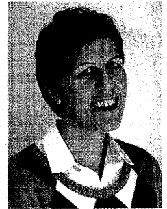
Pripravlja Irena Dolgan